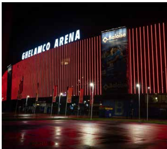
Ghelamco Arena - Ghent, Belgium